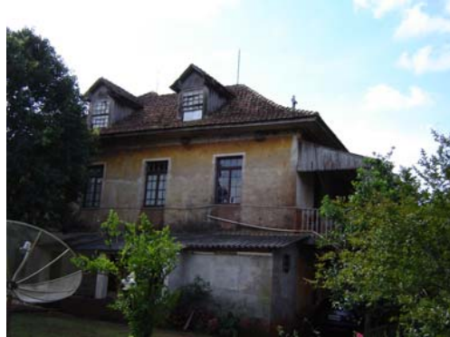
Boate Naimardi Construção de 1906