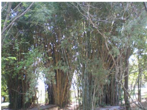
Barra da assunção do Ijuí

causadoras de degradação são processos erosivos, assoreamento do curso de água, plantas e animais invasores, pisoteio por gado, deposição de lixo e ocorrência de ruídos.