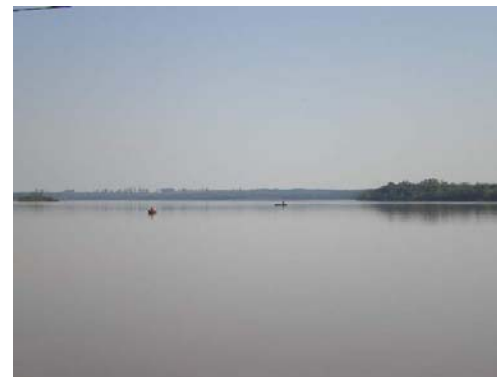
Encontro do rio Ijuí com o Uruguai

Os eventos que caracterizam Roque Gonzáles são a Festa dos Estados, que acontece de forma bianual, a Romaria Assunção do Ijuí, ocorrendo todos os anos, o Concurso Artístico e Literário Prêmio Missões, evento cultural que ocorre bianualmente, a Expo-Roque, evento comercial característico do município e que ocorre de 2 em 2 anos.