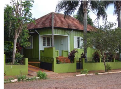
Exemplares da Arquitetura Popular