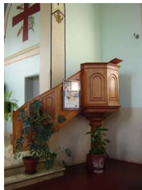
Igreja Evangélica Martin Lutero