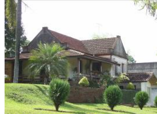
Casa da Família Lenz