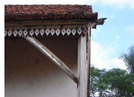
Casa Guido Grins

O elemento mais importante do Patrimônio Arquitetônico do município é o conjunto urbano de Vila Dona Otilia, com características da arquitetura alemã com elementos do Ecletismo. Encontram-se várias edificações ao longo de sua via principal, em geral em bom estado de conservação.