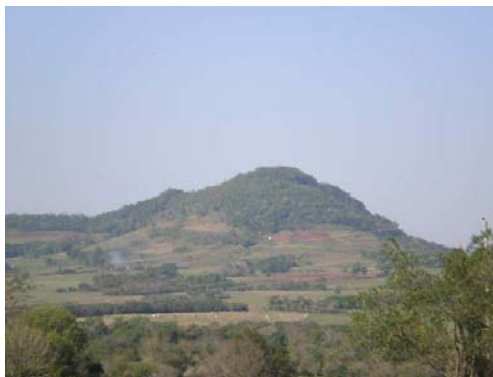
Cerro do Inhacurutum