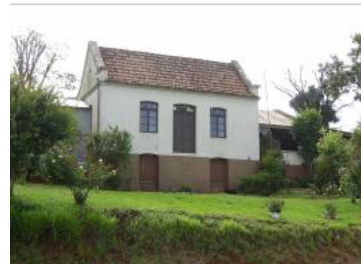
Casa da Família Wolffardt

Na Vila Dona Otilia vale destacar o conjunto formado pela Igreja Evangélica Martin Lutero, construção de 1930, típica da imigração alemã com decoração muito simples e a Capela Mortuária, construção com características de Eclético com elementos do Neoclássico e o cemitério da comunidade.